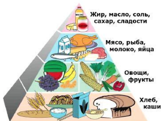
Пирамида здорового питания

К составлению полноценного рациона школьника требуется глубокий подход с учетом специфики детского организма. Освоение школьных программ требует от детей высокой умственной активности. Маленький человек, приобщающийся к знаниям, не только выполняет тяжелый труд, но одновременно и растет, развивается, и для всего этого он должен получать полноценное питание. Напряженная умственная деятельность, непривычная для первоклассников, связана со значительными затратами энергии.